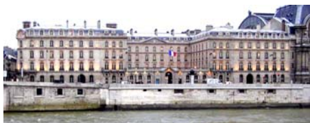
Filiale de la Caisse des Dépôts