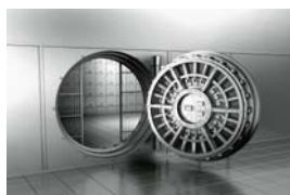
Tiers archiveur Tiers de confiance