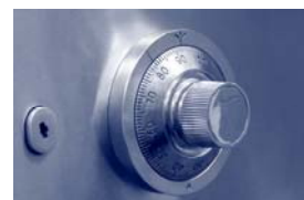
Solution externalisée Coffre-fort électronique®